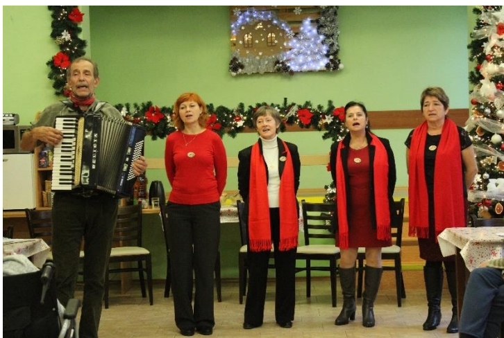
17. prosince nám zazpíval sbor Kružberských pěnkav.

20. prosince jsme společně poseděli, ochutnali vánoční jídlo, zazpívali jsme si koledy a připomněli si tradice, jako je například lití oliva nebo pouštění lodiček po vodě.