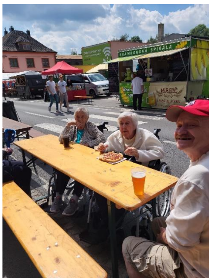
Navštívili jsme slavnosti ve Vrbně.