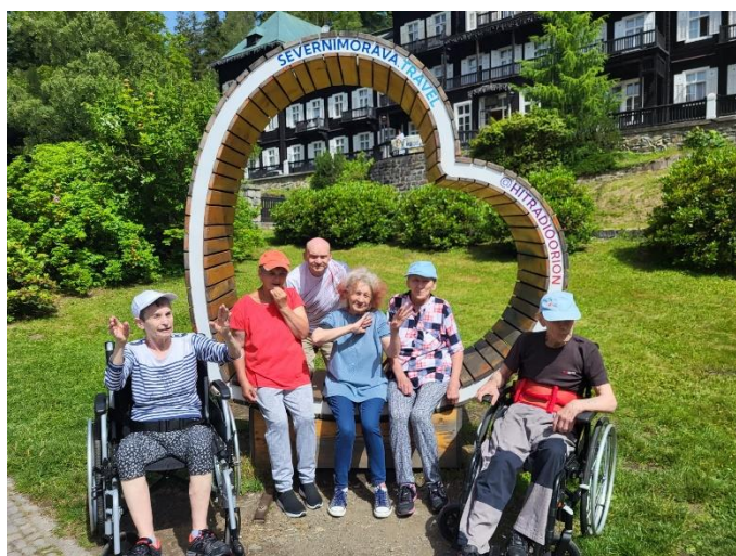
Navštívili jsme Zámek Hošťálkovy a Karlovu Studánku.